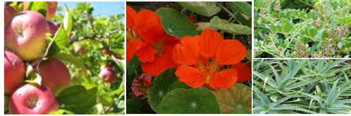
リンゴ果実培養細胞エキス

シートのピンク色は、イキイキとした肌へ導く「ビタミンB12」の色。「ビタミンB12」をたっぷり配合することで、シートがピンク色に。まるでシートのように血色の良い肌へと導きます、その他にも、くすんだ肌を明るくする「金蓮花エキス」、くさらないリンゴで有名な奇跡のリンゴの幹細胞から培養した「リンゴ果実培養細胞エキス」のほか、「グリチルリチン」、「天然植物混合エキス」、「ビタミンP」、「ダブルビタミンC」などの厳選したスキンケア成分が、若々しい印象の肌へと導きます。