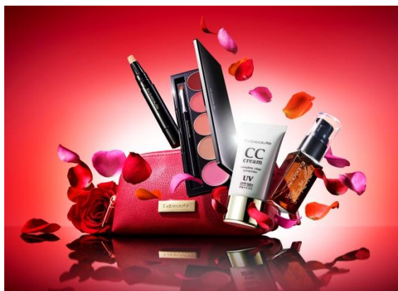
リフトアップコフレ（メイクセット）