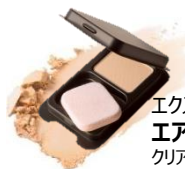
エクスポーテ エアーステイングパウダー クリア/2g

驚くほどの軽さとキメ細かさで、サラサラの肌へ導く、仕上げ用パウダー。汗や皮脂などのテカリやメイクくずれをガードして、長時間つけたての肌を持続します。