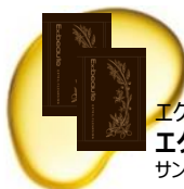
エクスポーテ エクストオイルクレンジング サンプル 2回分

厳選13種の美容オイル配合で、洗いあがりの肌が潤う新発想のクレンジング。抜群のメイク落ちと、乾燥小ジワケアを同時に叶えます。