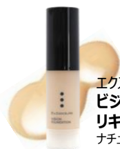
エクスポーテ ビジョンファンデーション リキッド モイストタイプ ナチュラルオークル02/15g

みずみずしいつけ心地で、さっとひと塗りで肌へピタッと密着する美容液ファンデーション。優れたカバー力なのに、透明感あふれる自然なツヤ肌へと導きます。